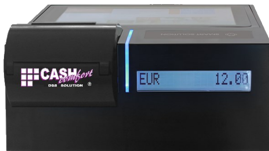
CASH Solution FRONT-END PUNTO CASSA

Ihr kompaktes, platzsparendes Format macht dieses Produkt zur idealen All-in-One-Lösung!